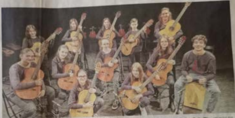
Les douze élèves provençaux, reviennent de plusieurs dates en Alsace, aux côtés de l'association Guita'Rix.